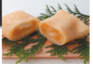
「柏屋光貞」が祇園祭宵山の日にだけに発売する伝統菓子「行者餅」