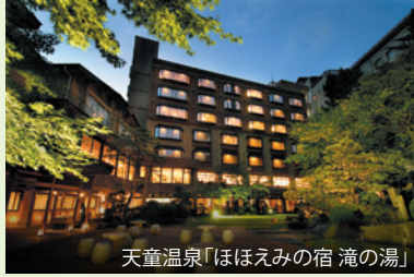
天童温泉「ほほえみの宿 滝の湯」