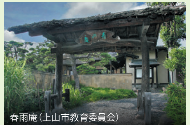
春雨庵(上山市教育委員会)