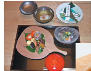
かに家お料理(イメージ)