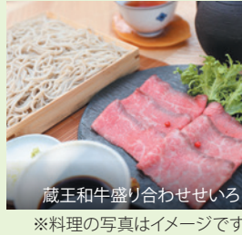
蔵王和牛盛り合わせせいろ ※料理の写真はイメージです