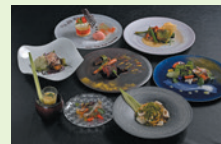
ランチコース「イタリアンの庭」(イメージ)