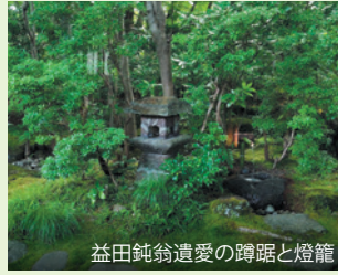
益田鈍翁遺愛の蹲踞と燈籠

石臼挽きの香り高い蕎麦「でわかおり」と、とろけるような蔵王和牛の盛り合わせをご賞味ください