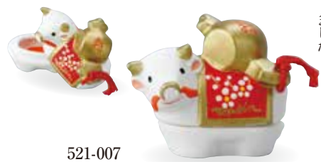
521-007 丑歳 丑に小槌香合 1,650 円 (本体 1,500 円) 紙箱 [寸法] 7cm×3.7cm 高さ 5.7cm (瀬戸)