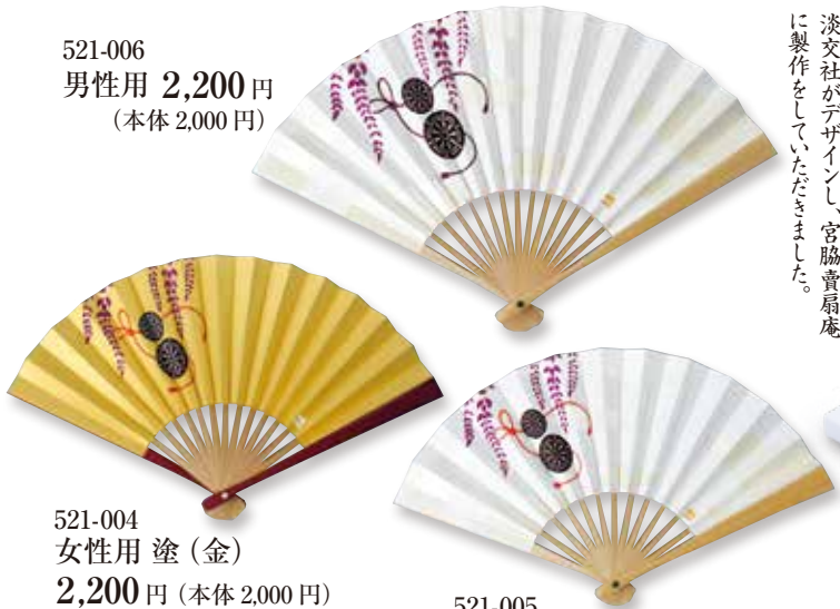
521-006 男性用 2,200 円 (本体 2,000 円)

御所車と藤をモチーフにしました。 塗扇子は金で豪華に、白竹扇子は 地紋に霞をあしらひ、優美に仕上げ ました。 淡交社がデザインし、宮脇賣扇庵 に製作をしていただきました。