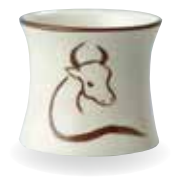
521-008 丑歳 志野蓋置 1,100 円 (本体 1,000 円) 紙箱 [寸法] 径 5.4cm 高さ 5cm (瀬戸)